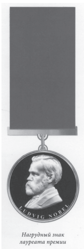
Нагрудный знак лауреата премии